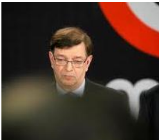
Paavokin pahoitti mielensä Ropeconin vuoksi.

Niin moni ohjelmanjärjestäjä, larpinvetäjä, korttipeliturnauksen tuomari, figuharrastaja, pukunäytössaktiivi, lautapelitiskin työntekijä ja pöytäpeli-gm on toivonut lupaa pyroteknisille efekteille, joilla ilahduttaa ja hauskuuttaa conikävijöiden päivää ja tehdä ohjelmanumerostaan ikimuistoinen elämys. Mutta ei. Vaikka lupaa kysyttiin jo viikkoa ennen conia, ei lupaa herunut. Epäreilua!